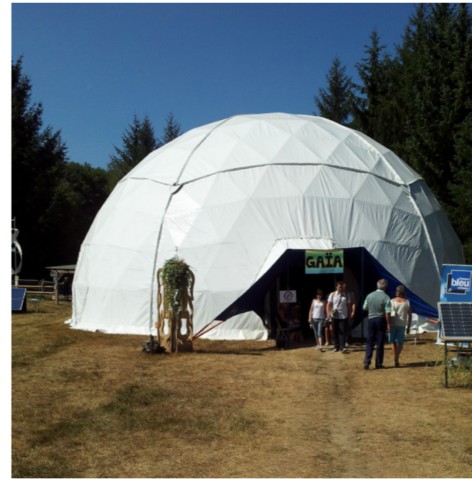
Festival Forêts et folies, Creuse.

Présentant une économie de moyens et une esthétique de pureté dans sa forme, le dôme géodésique permet de multiples configurations adaptées au spectacle vivant ou à l'événementiel.