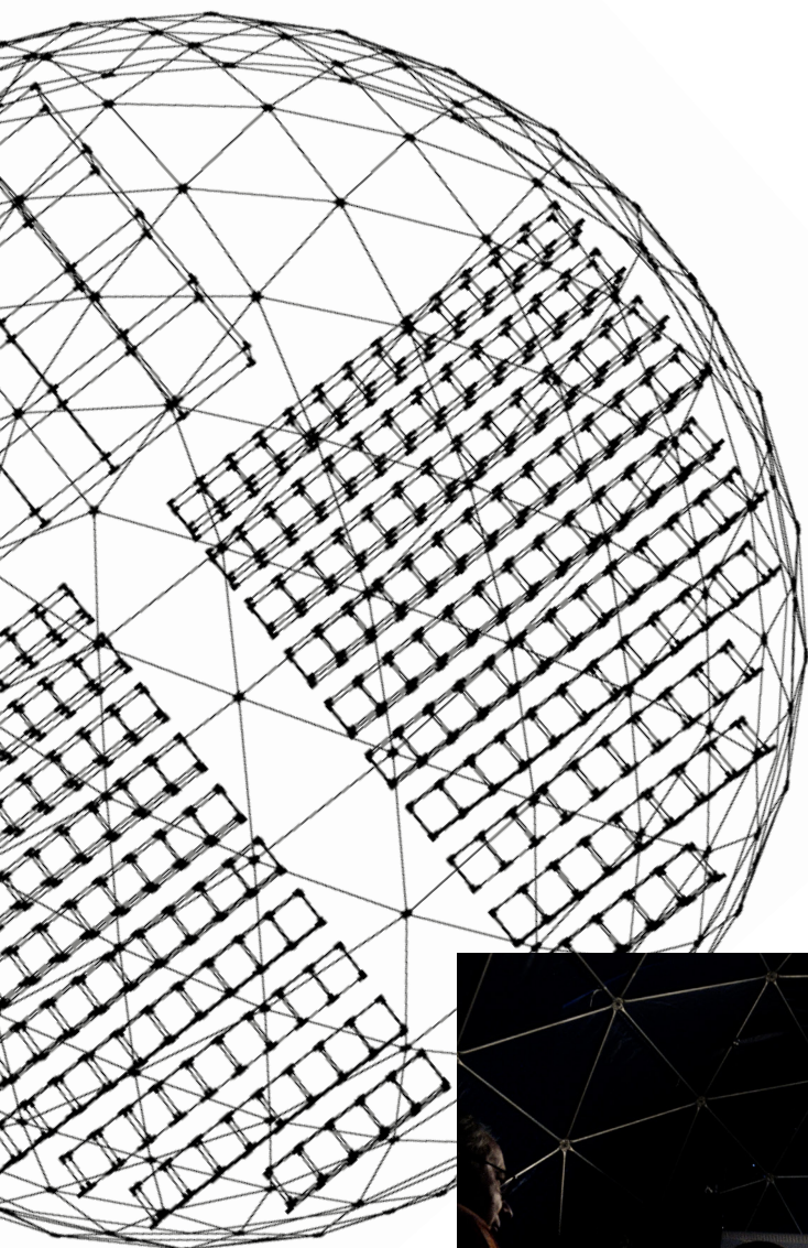
Représentation des Onze Tableaux de l'Escouade , Fort de Condé.

N° homologation : S/50/2012/002, délivré par la préfecture de la Manche.