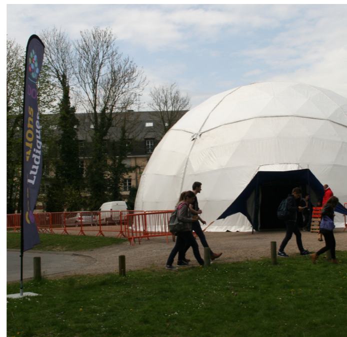
Festival Connexions ludiques, Amiens.

Dans sa démarche citoyenne, consciente des problèmes liés à la consommation d'énergie dans le milieu du spectacle, la Cie Les Mélangeurs s'est dotée de matériel de lumière à Led pour aménager son dôme. Pour cela, elle a été aidée en 2010 par l'Union Européenne, le Conseil régional de Picardie et la ville de Château-Thierry.