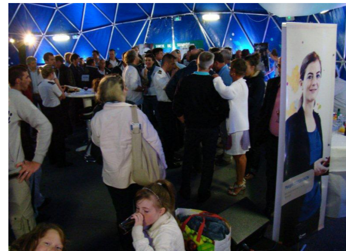
Événement ERDF, Cherbourg.